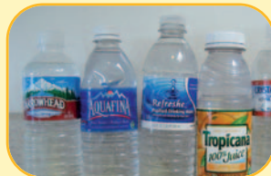
PLASTIKOAK / PLÁSTICOS