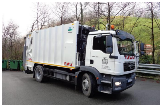
Udazkenean bilketarako kamioi berria lortzea aurreikusi dute.